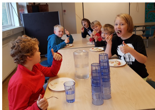
Krakkarnir voru ánægð

“Þetta er besti matur sem hefur verið í Dalheimum“ - barn að borða