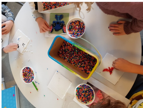
Flestum finnst gaman að perla