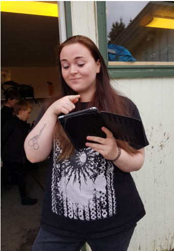
Skrá inn í ípad

Eftir Andreu Emblu og Bryndísi Línu, 04.10.2022